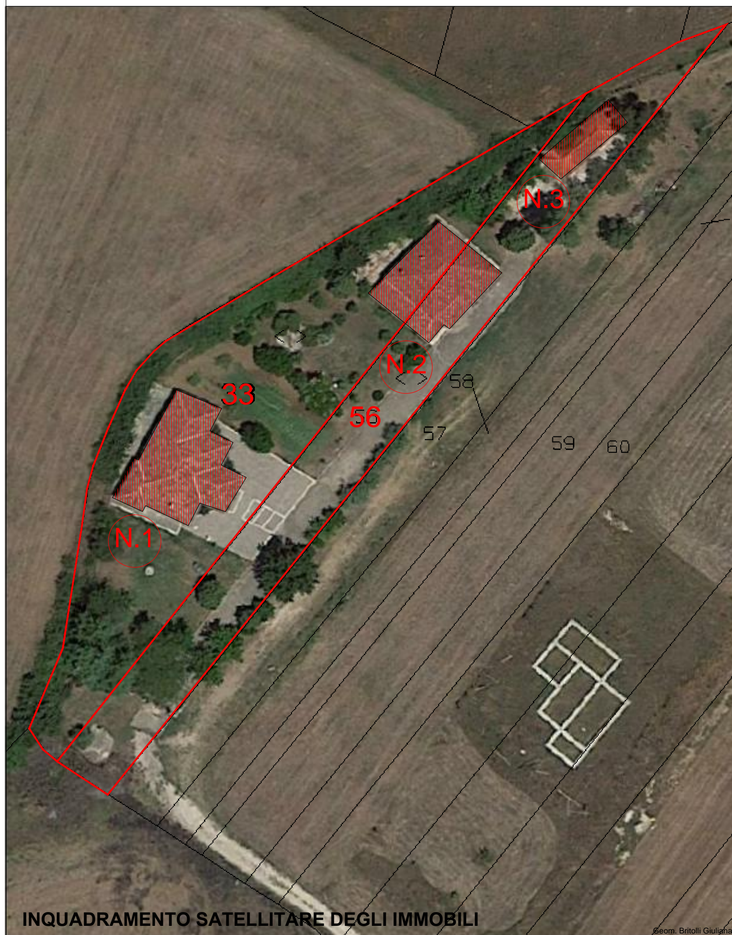
INQUADRAMENTO SATELLITARE DEGLI IMMOBILI

IMMOBILI OGGETTO DI CONCESSIONE A TITOLO GRATUITO AI SENSI DELL' ART.48 DEL D. Lgs. N. 159 DEL 06.09.2011 (ALLEGATO ALL'AVVISO PUBBLICO DEL 04.01.2017)