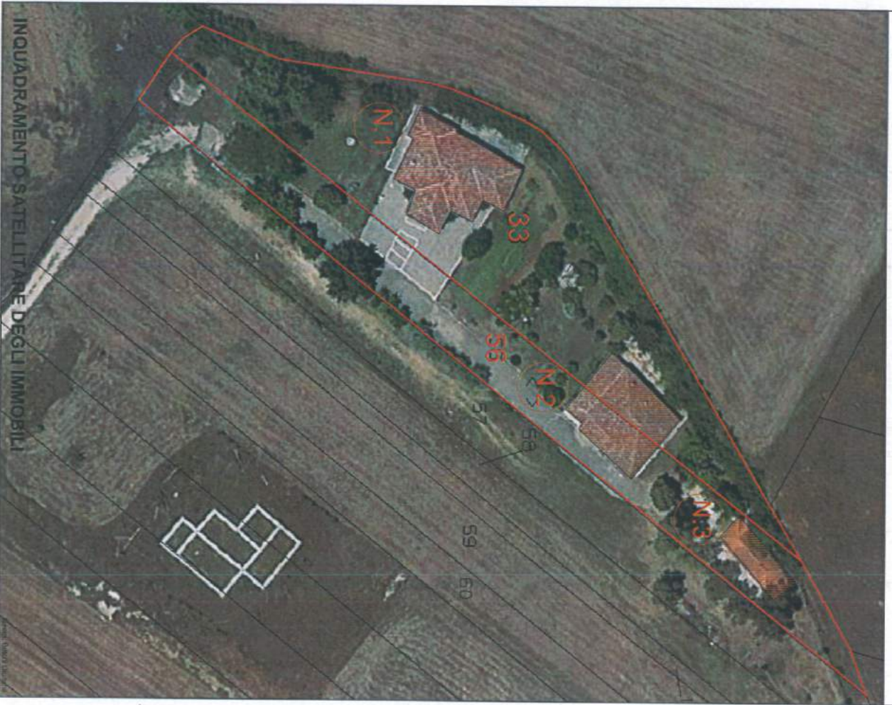
INGUADRAMENTO SATELLITARE DEGLI IMMOBILI

IMMOBILI OGGETTO DI CONCESSIONE A TITOLO GRATUITO AI SENSI DELL' ART.48 DEL D. Lgs. N. 159 DEL 06.09.2011 (ALLEGATO ALL'AVVISO PUBBLICO DEL 04.01.2017)